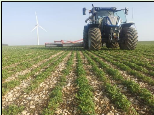
Roulage du Fenugrec en argilo-calcaire

C'est une étape importante pour cette culture, il permet un meilleur enracinement de la plante. Il ne faut pas avoir « peur » de rouler au début du printemps un fenugrec qui est déjà bien développé. Nous conseillons de rouler le fenugrec deux fois (automne/sortie hiver).