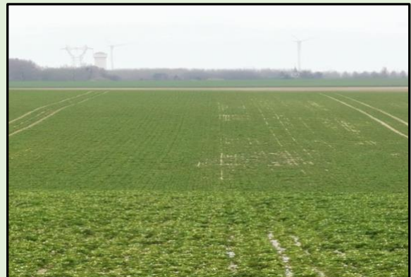
A gauche : roulé / A droite non roulé